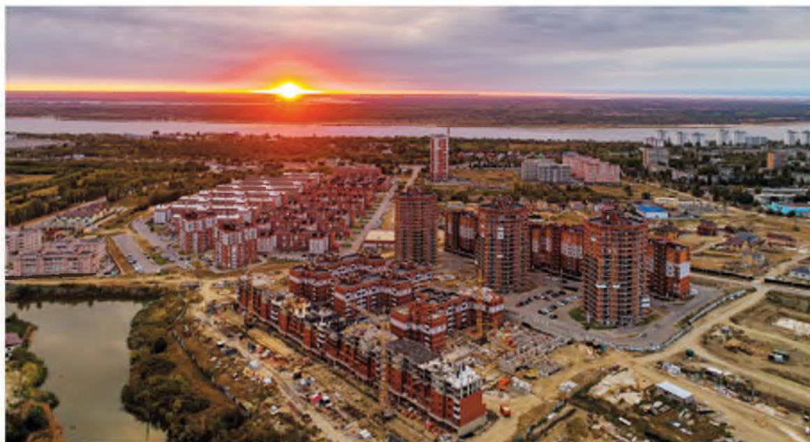
На правах рекламы.

Более чем за четверть века работы торгово-промышленная группа «БИС» реализовала большое количество масштабных проектов, которые были отмечены как на региональном, так и на федеральном уровне. К примеру, микрорайон Санаторный назван Минстроем России «Лучшим проектом комплексного освоения территорий». «Стройсервис» не только сохраняет заданный темп строительства, а также имеет большие планы на 2019 год, в число которых входит строительство новых теплых домов из высококачественных строительных материалов!