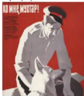
КО МНЕ МУХТАР!

Пер. М. Горького, д. 12, кв. 15. Тел. 3-16-18. *Членство в кооперативе обязательно