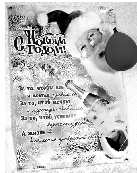
Наталья ЗУБРЕВА.

Заключает публикацию о хуторском сходе клубный плакат – пусть наконец сбудутся эти пожелания!