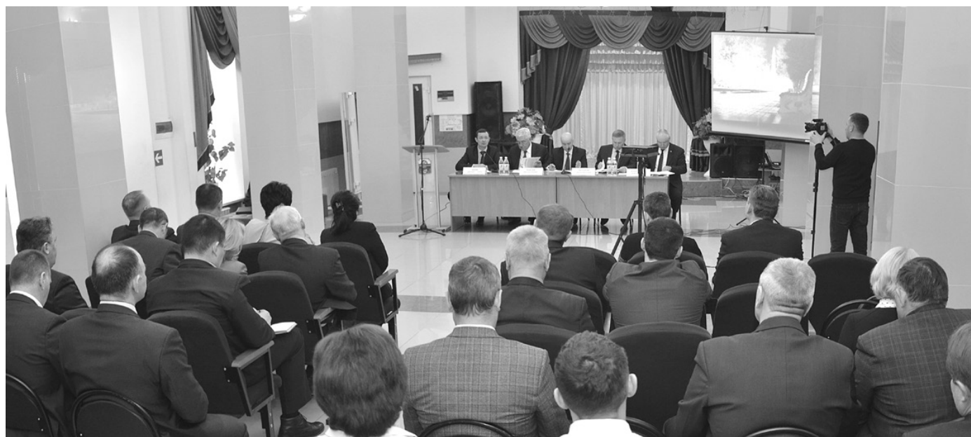
Продолжение на 2-й странице.

На заседании Палаты городских поселений Совета муниципальных образований планировали обсудить три основных вопроса: обменяться опытом по ремонту, капитальному восстановлению и реконструкции дорог местного значения; услышать информацию о постановке на государственный и кадастровый учёт границ поселений и их территориальных зон в соответствии с генеральными планами; узнать ход реализации схемы обращения с твёрдыми коммунальными отходами и определить точки взаимодействия с региональным оператором по вопросам организации площадок для накопления ТКО в поселениях. Однако разговор затронул более широкий спектр деятельности власти.