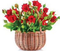
ДОЧЕРИ, ЗЯТЬЯ, ВНУКИ.

Единственной, родной, неповторимой Мы в этот день спасибо говорим, За доброту и сердце золотое Мы, мама милая, тебя всегда благодарим. Пусть годы не старят тебя никогда, Мы, дети и внуки, все любим тебя!