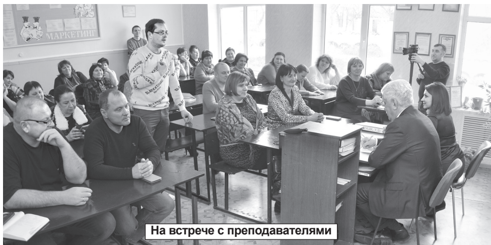
На встрече с преподавателями

- Главная идея Послания президента – сбережение и приумножение народонаселения страны, - сказал депутат. - Владимир Владимирович поставил актуальные социальные задачи, многие из которых уже на-