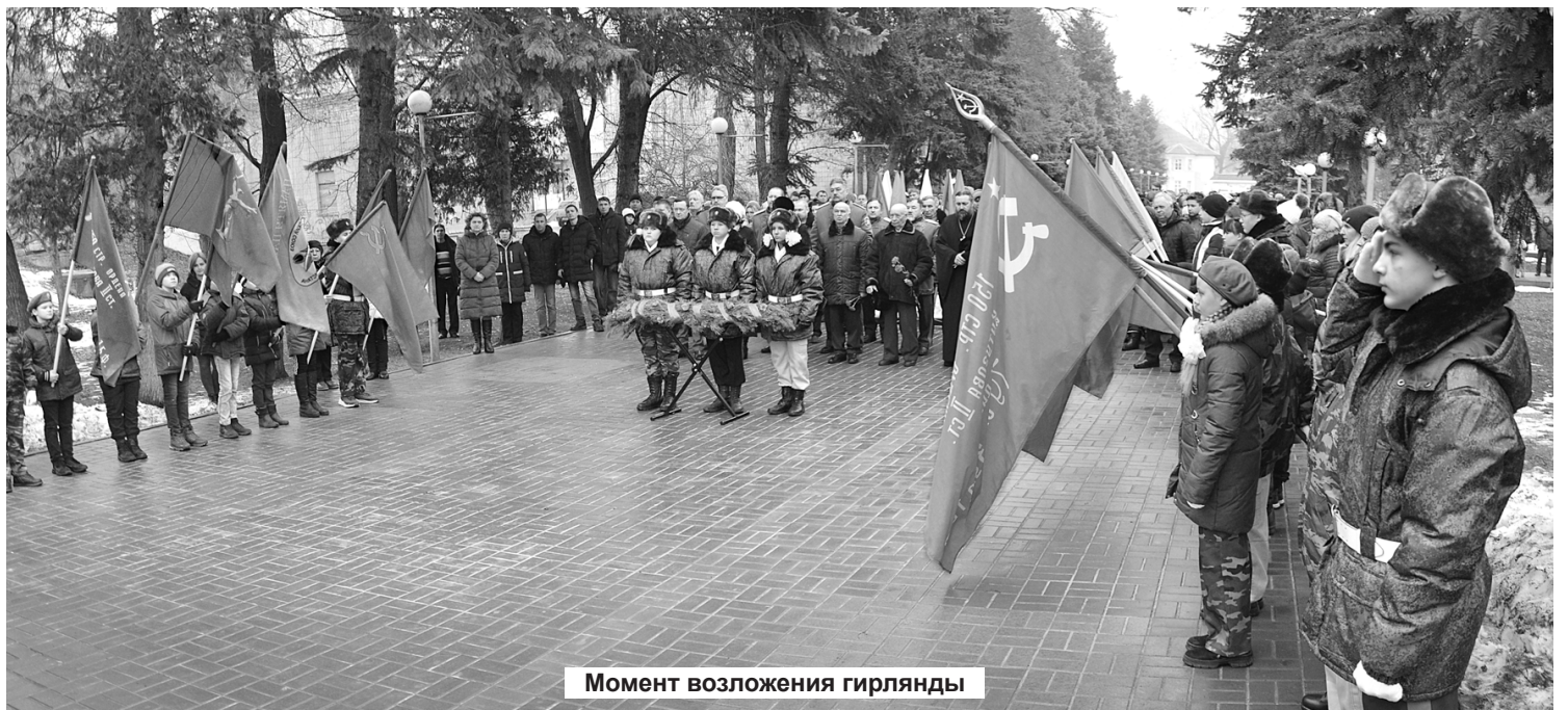
Момент возложения гирлянды

Продолжение о событиях 2 февраля - в следующем номере газеты.