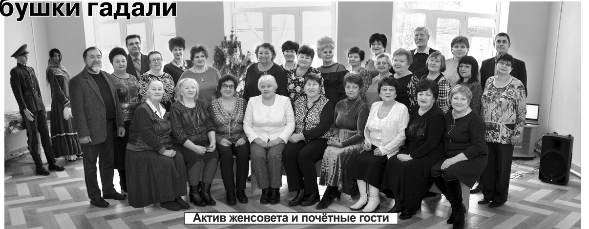
Актив женсовета и почетные гости

- Колодец из спичек складывали, чтобы во сне суженый пришел воды попить. Валенки через забор бросали, потом еле нашли - ребя-