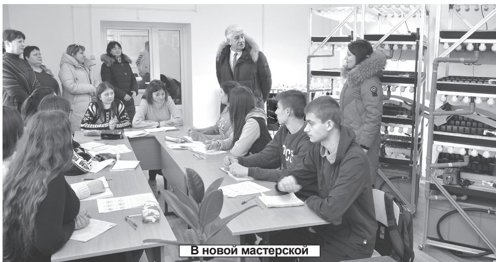
В новой мастерской

Многие другие аспекты перемен, происходящих в социальной политике государства, обсудили во время этого разговора: предоставление мест детям в яслях, увеличение количества бюджетных мест в вузах, обеспечение больных льготными лекарствами и другие. Педагоги активно задавали депутату вопросы, в частности, выразили мнение о несправедливости начислений в размере не менее 5 тысяч рублей из федерального