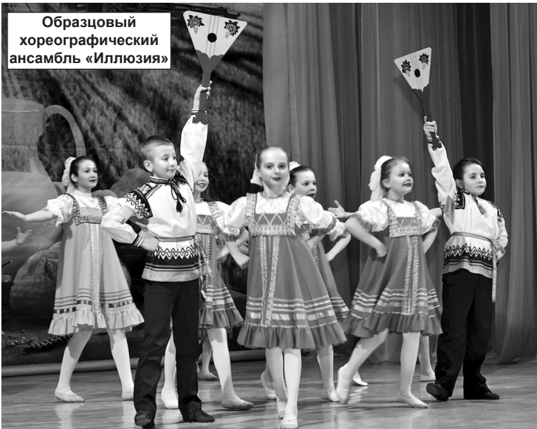
Образцовый хореографический ансамбль «Иллюзия»