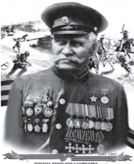
ЛЕГЕНДА ДОНСКОГО КАЗАЧЕСТВА КОНСТАНТИН ИОСИФОВИЧ НЕДУРУБОВ, ПОЛНЫЙ ГЕОРГИЕВСКИЙ КАВАЛЕР, ГЕРОЙ СОВЕТСКОГО СОЮЗА

В обширной программе праздника «Казак на века!», который состоится 18 мая в станице Березовской Даниловского района, митинг и иные торжественные мероприятия, выставки