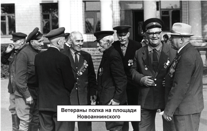
Ветераны полка на площади Новоаннинского