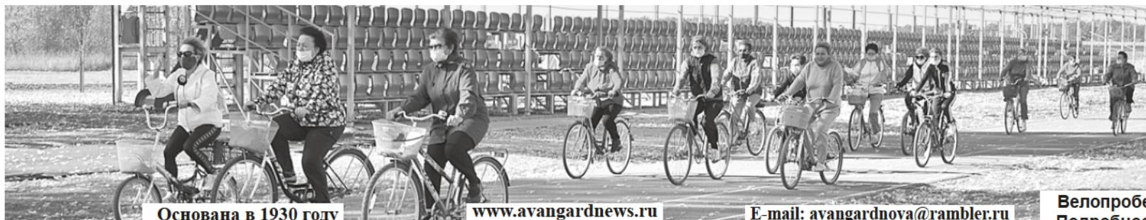
Основана в 1930 году