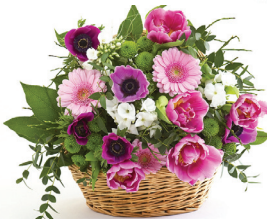
ДЕТИ, ВНУКИ, сваха НАДЯ,

Живи, родная, до 100 лет И знай, что лучше тебя нет. Чтоб рядом с нами ты была Сегодня, завтра и всегда. Желаем жить без старости, Здоровья - без лечения, Желаем благ тебе земных, Мы знаем: ты достойна их!