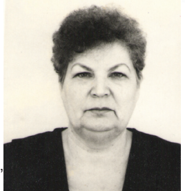
МУЖ, ДЕТИ, ВНУК.

Желаем здоровья, счастья, радости, Благополучия и исполнения желаний. Что пожелать тебе - не знаем: Добра, богатства, красоты. Но лучше, если рядом с нами Всегда счастливой будешь ты. Бери из жизни всё, что можешь, Что в ней прекрасно и светло, Ведь жизнь на жизнь не перемножишь, А дважды жить не суждено!