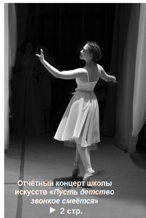
Отчётный концерт школы искусств «Пусть детство звонкое смеётся»