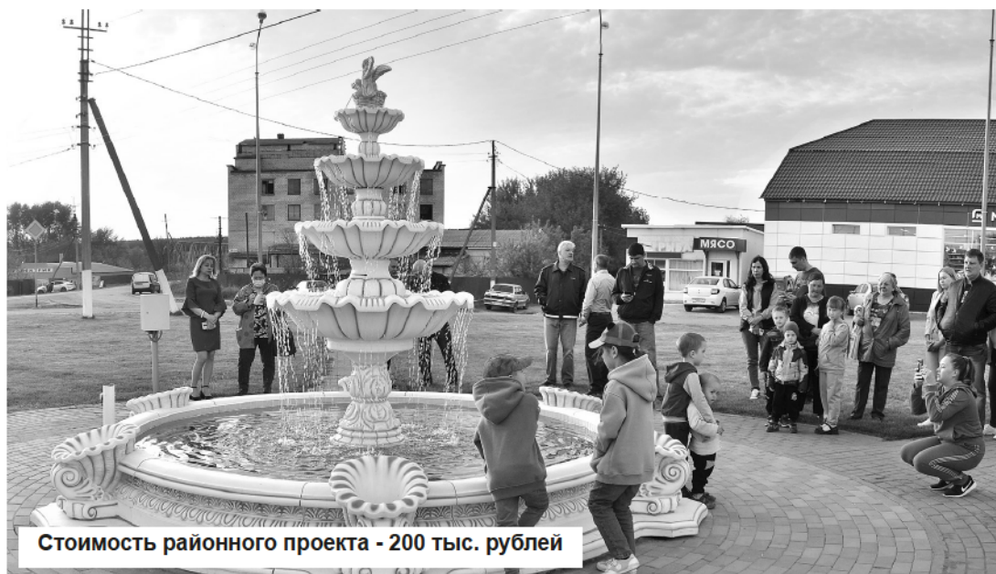
Стоимость районного проекта - 200 тыс. рублей

В череде праздничных событий – открытие фонтана на «пяточке» автомобильного кольца, объединяющего улицы Советскую, Рабочую, Крестьянскую, Пугачевскую. Лет десять назад это некогда заброшенное место стало постепенно преображаться. Появилось кольцевое уличное освещение, зазеленел газон (кстати, очень неплохого качества), разбитый радиальными дорожками, ежегодно радует своим цветением многоярусная контрастная клумба. И вот очередной этап благоустройства – белоснежный каскадный фонтан.