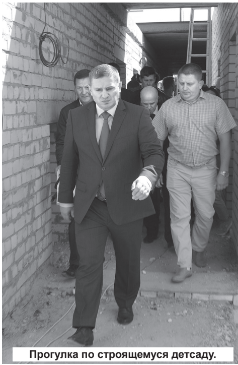
Прогулка по строящемуся детсаду.

- Что касается непосредственно Новоаннинского района, то здесь произошли изме-