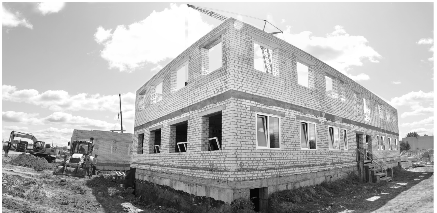
Так сейчас выглядит будущий детсад.