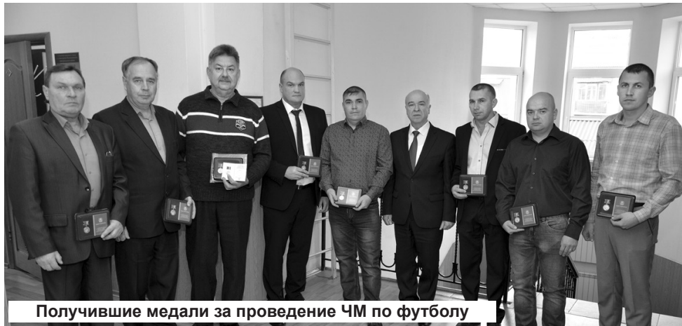
Получившие медали за проведение ЧМ по футболу