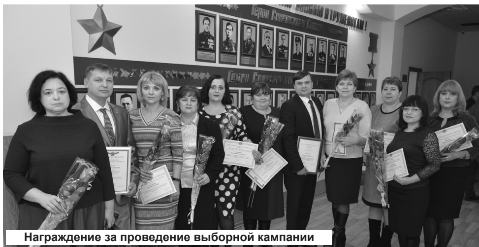
Награждение за проведение выборной кампании