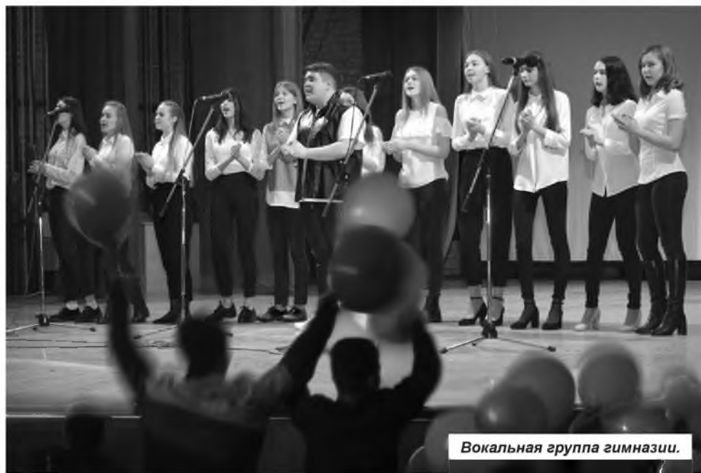
Вокальная группа гимназии.